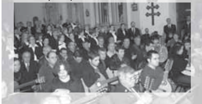
Coros participando en la Ofrenda-Funeral