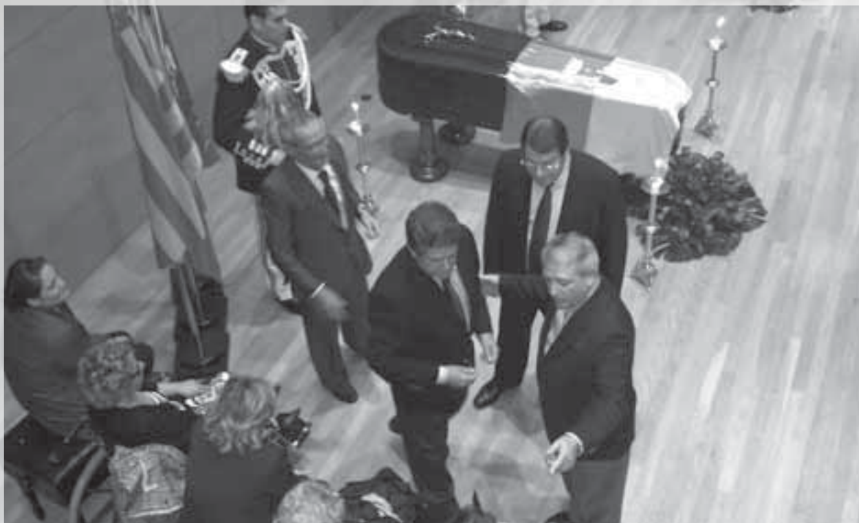
El Hijo Adoptivo de la Ciudad y ex-ministro, Federico Trillo, durante su visita a la capilla ardiente