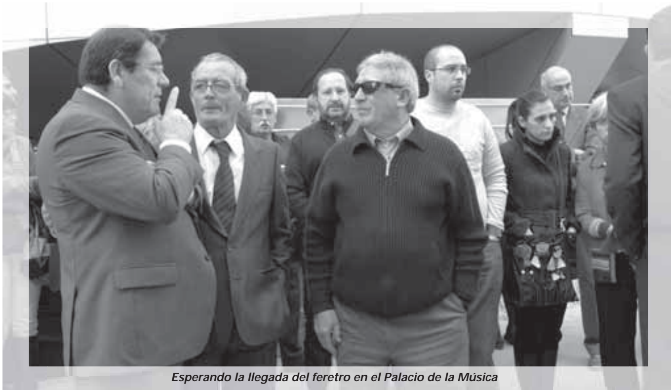
Esperando la llegada del feretro en el Palacio de la Música