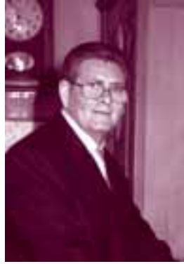
Por Francisco Soribella López