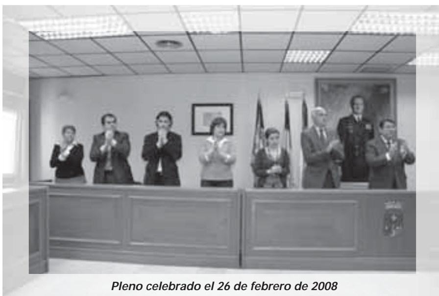
Pleno celebrado el 26 de febrero de 2008

ración institucional que fue suscrita por la totalidad de los grupos políticos, PP, PSOE, IU y LV, a través de la cual se declararon en la ciudad tres días de luto oficial, en los que ondearon a media asta las banderas de los centros institucionales.